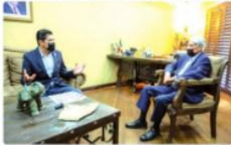
ENSENADA.- Abogado de consultoría contratado por el gobierno estatal, Ayala Roldán, agredió al gobernador Jaime Bonilla y anunció acciones en materia de seguridad pública.

Asimismo, el alcalde de Ensenada, anunció importantes acciones en materia de seguridad pública